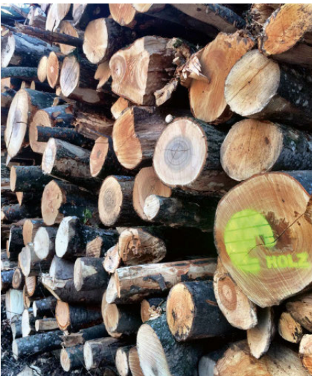
Hochwertiges Schnitzelholz, 1 Jahr im Wald vorgetrocknet und ohne Äste.