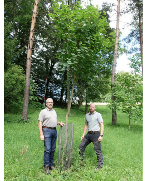
Lichter Föhrenwald – Ziel ist die Förderung der Orchideen mittels (hier) zweimaliger Mahd und Ausmagerung des Standorts durch Abtransport des Grüngutes.